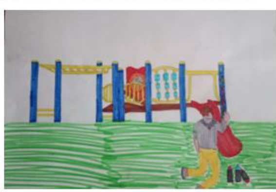
Uso inadecuado de muelles a los juegos infantiles

Resultados del trabajo pedagógico en el Aula de clase - IED Hunza Bogotá