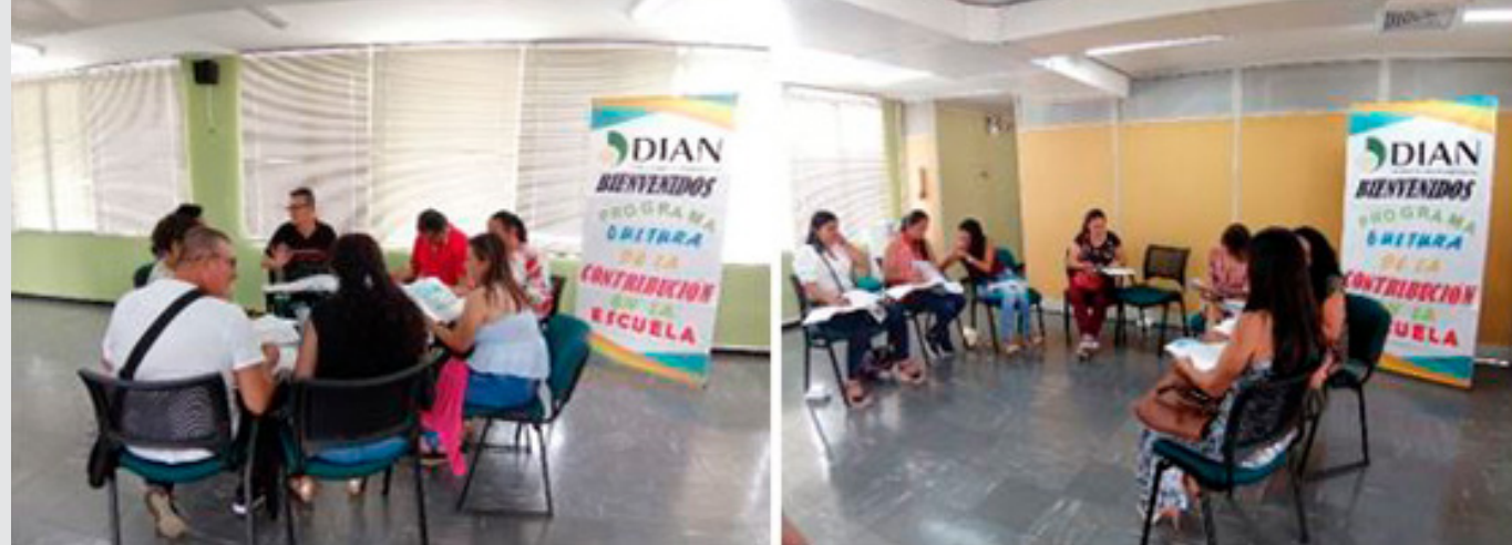
Desarrollo Curso presencial cultura de la contribución en las instalaciones de la dirección seccional Florencia.

Como evidencia del férreo compromiso por parte de las secretarías de educación del Caquetá y sus establecimientos educativos se resalta: la participación en cada Semana Nacional de la Cultura de la Contribución con sus buenas prácticas, que van desde ejercicios en redes sociales y medios de comunicación internos, la realización de jornadas lúdico-recreativas como "Jugando con los Impuestos", y ferias empresariales en donde se vivencia la función de los impuestos en la construcción colectiva del bienestar de los colombianos.