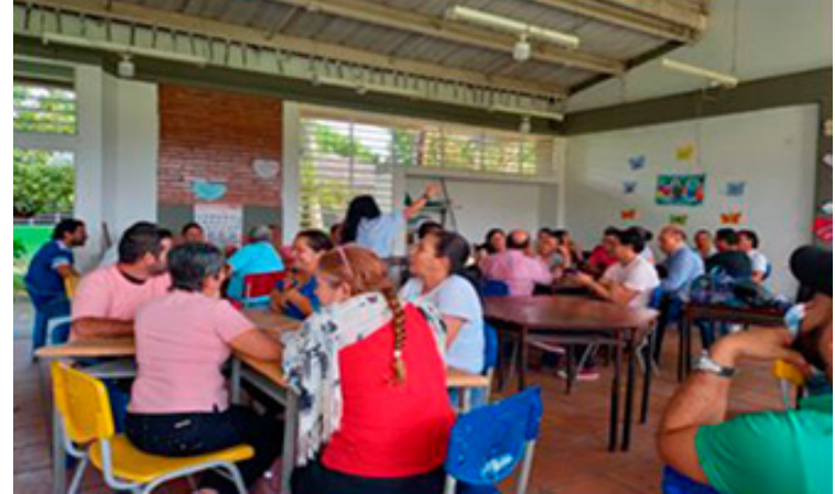
Jornada de capacitación docentes de la IE Francisco Torres León del Municipio de Restrepo - Nov, 2022