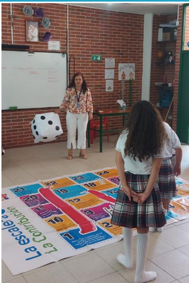
Estudiantes del Colegio Eucarístico Jugando la Escalera de la Contribución