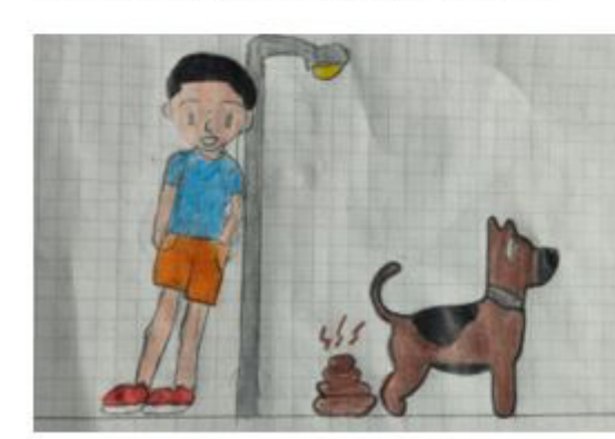
No recoger las heces de los animales de compañía