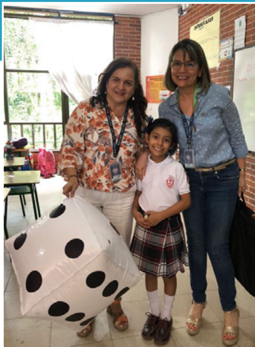
Líderes CCE Ibagué y estudiante de la Colegio Eucarístico de Ibagué