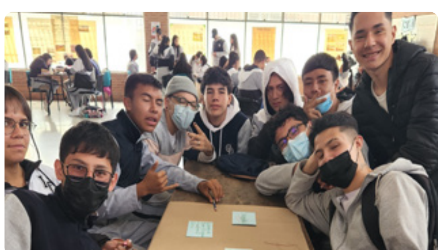
I.E.D. La Chucua