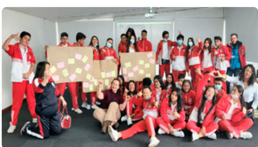
Colegio INEM (Tunja)

También está en la localidad de Kennedy, en el colegio La Chucua, con la participación de 120 estudiantes.