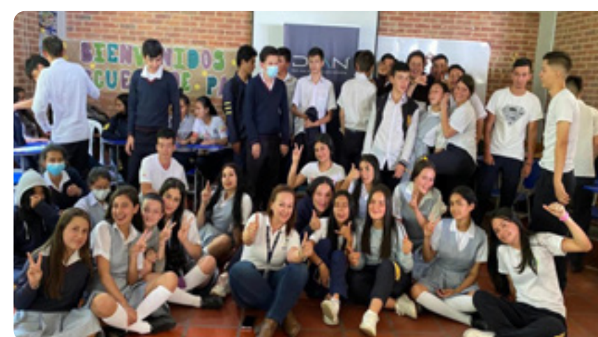
I.E.D. Técnico Comercial Puente Quetame