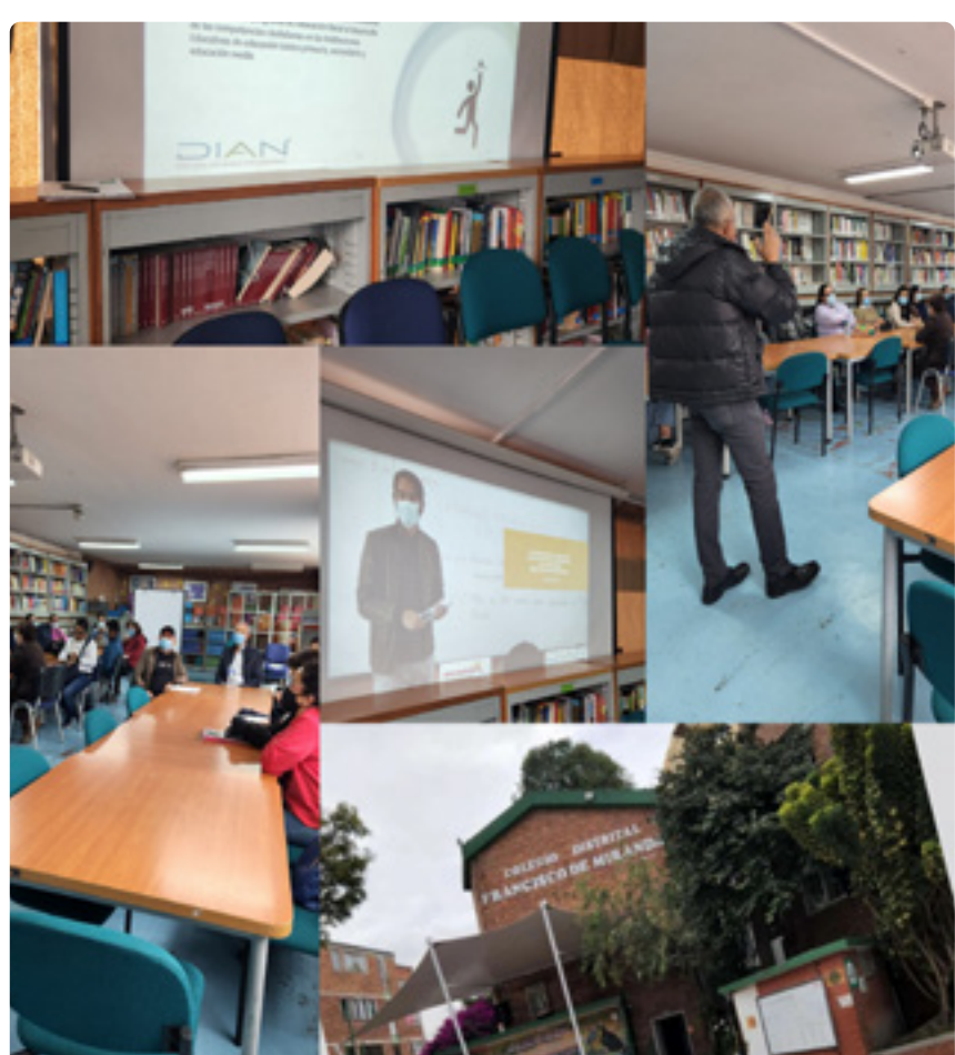
IED Francisco Miranda

Por otra parte, la Seccional viene realizando jornadas pedagógicas dirigidas a estudiantes de 9°, 10° y 11° de las Instituciones Educativas.