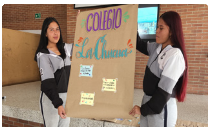
I.E.D. La Chucua

En el año 2022 se ha llevado la actividad a las Instituciones Educativas Puente Quetame, en el municipio de Quetame, Cundinamarca, con la asistencia de 150 estudiantes.