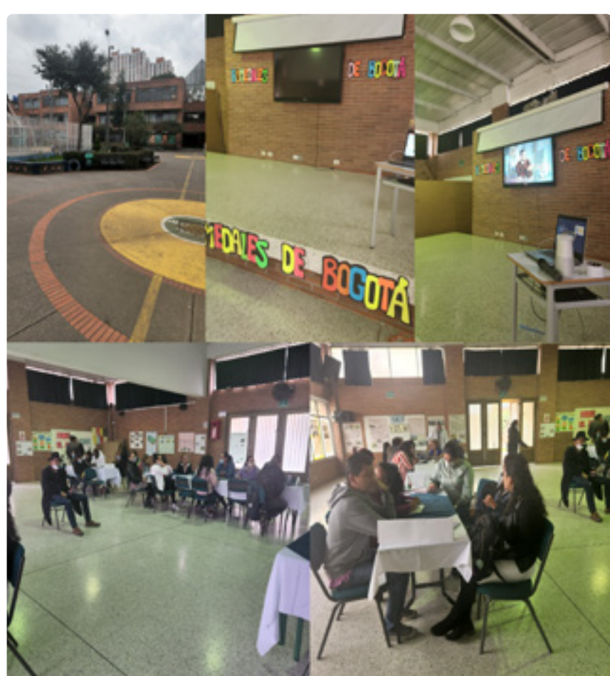
IED La Chucua