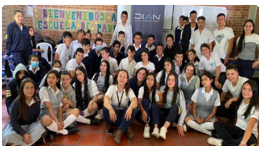
I.E.D. Técnico Comercial Puente Quetame