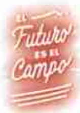
JOHN WILMER CAMPO FLOR Alcalde Municipal

📍 Calle 5° No. 1-34/38 CAM ☎ 310 435 5192 ✉ Código Postal 190501