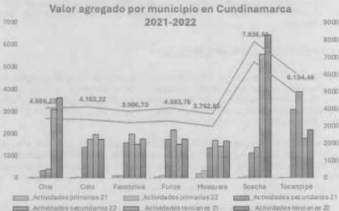
Gráfica 1. Comportamiento valor agregado municipio de Cota y aledaños 2011-2022

En la siguiente gráfica, se observa el comportamiento de las actividades económicas de Cota y municipios aledaños para el periodo 2011-2022, en donde se evidencia que el municipio ha tenido un crecimiento constante y sostenible.