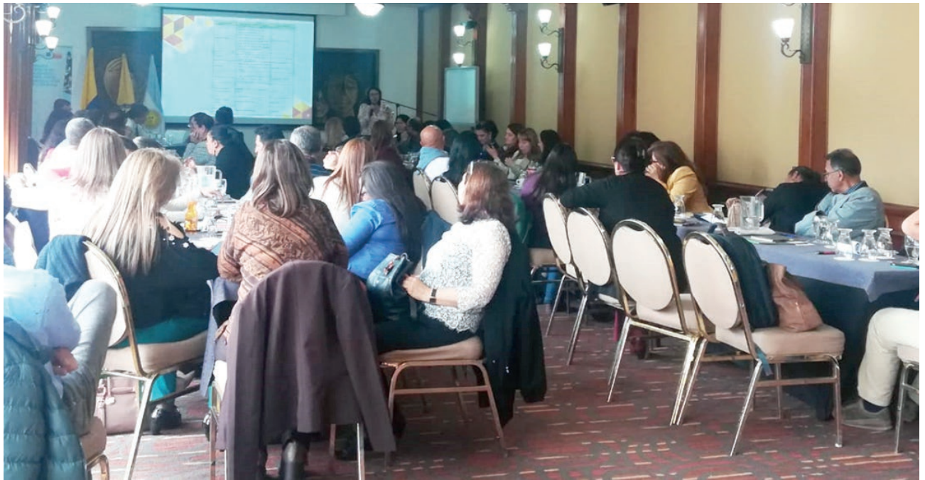
Jornada de capacitación con maestros del Distrito Capital en el Hotel Tequendama.

Como elemento sustancial y transversal de la política educativa de la Alcaldía Mayor de Bogotá, la Secretaría de Educación del Distrito, le apuesta al programa “Cultura de la Contribución en la Escuela”, al ser una iniciativa que encamina a la formación de futuros ciudadanos capaces de construir un nuevo tejido social basado en la institucionalidad.