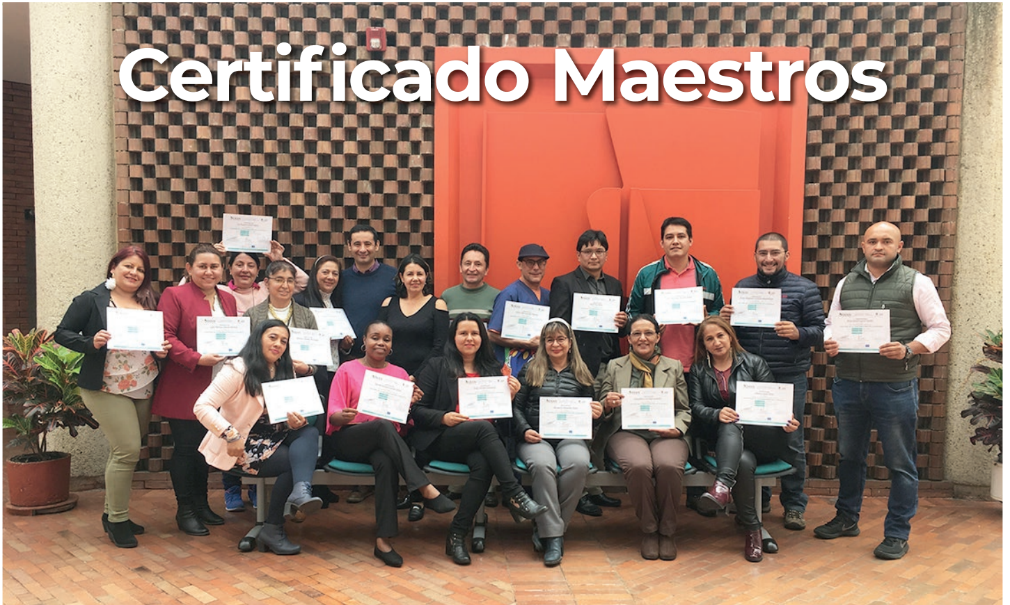
Jornada de socialización 2019. Inserción de contenidos de educación fiscal y entrega de certificados a maestros participantes del Distrito Capital.