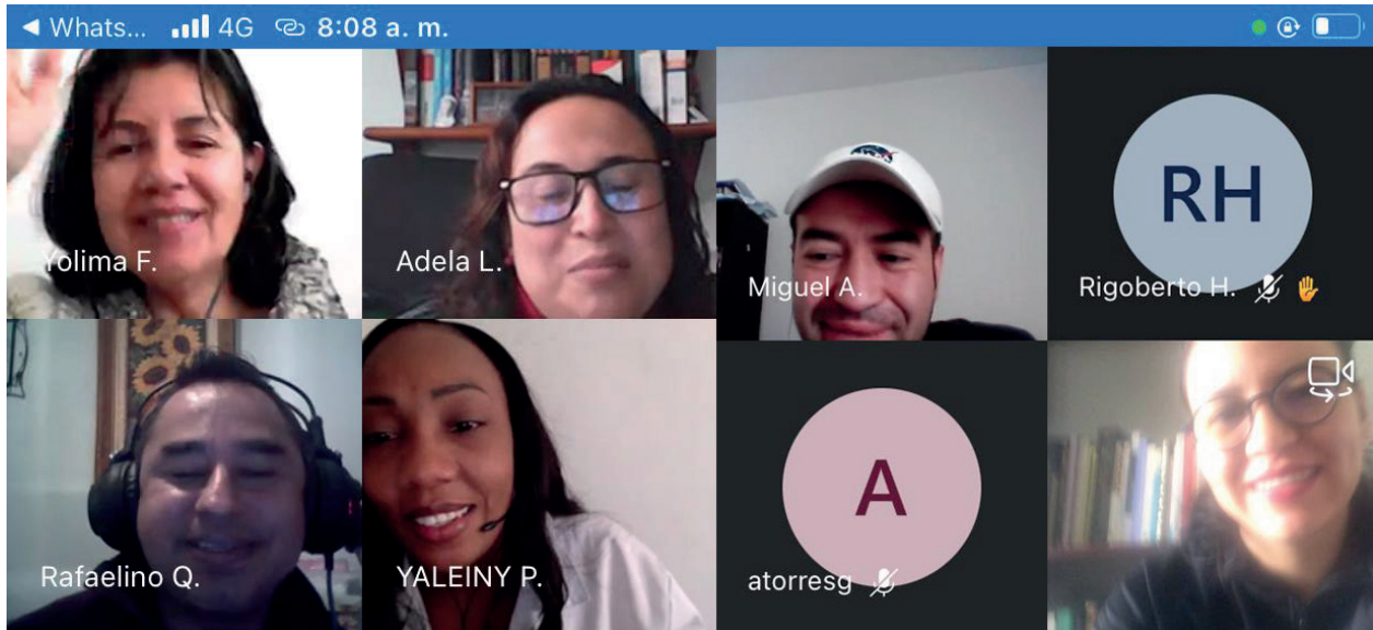
Equipo de instructores del SENA que viene realizando la capacitación a los maestros vinculados al programa.

Por: Yolima Fabiola Melo Romero Coordinación de Cultura de la Contribución Subdirección Gestión de Asistencia al Cliente