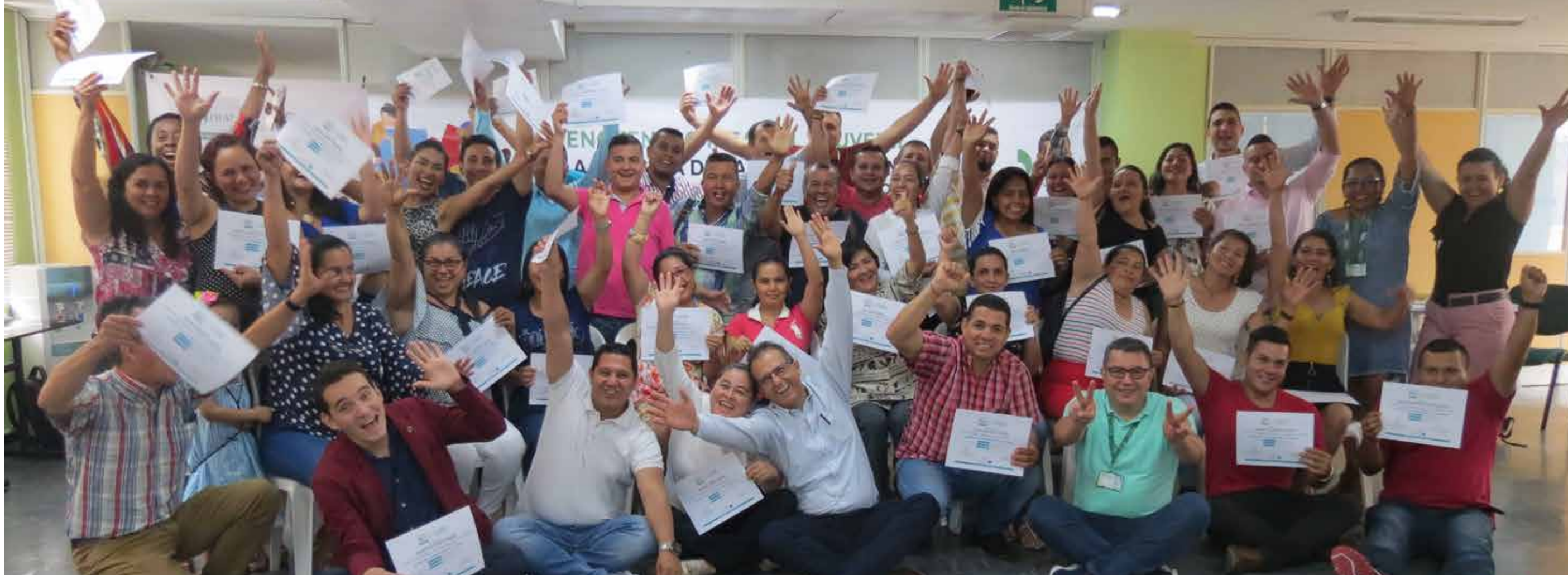
Maestros de Instituciones Educativas de los Municipios del Caquetá recibiendo certificación de capacitación para desarrollar los contenidos del Programa Cultura de la Contribución en la Escuela, año 2019.