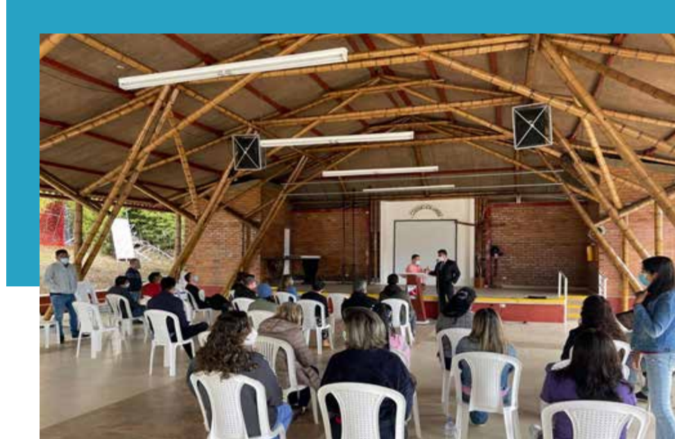
Reunión de seguimiento del mes de julio de 2021 entre la Dirección Seccional de Impuestos y Aduanas de Popayán con los docentes de la Institución Educativa Colegio Los Andes, Popayán - Cauca.