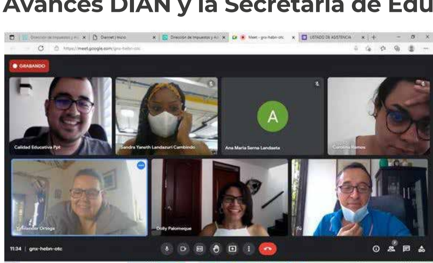
Reunión Secretaría de Educación de Cali y Seccional de la DIAN, 10 de junio de 2021.