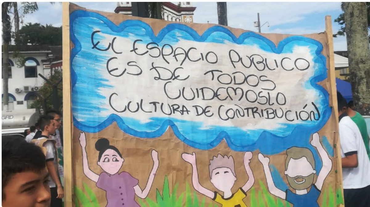
Carteles preparados por estudiantes de colegios vinculados al programa, en el marco de la 1ª Semana de la Cultura de la Contribución en Florencia (Cauquetá)