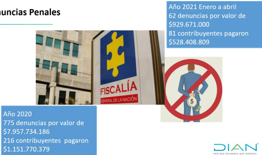
Ilustración 23. Gestión denuncias penales realizadas por la DG jurídica 2020 y 1er cuatrimestre 2021

El Dr. Carlos Enrique Ariza, enfatiza que el contribuyente no debe esperar a que la DIAN los denuncie penalmente, puesto que muchos de esos contribuyentes que cumplen con la obligación posterior a la denuncia, continúan con un proceso activo ante la Fiscalía, no interesa que la División de Recaudo y Cobranzas remita las respectivas certificaciones o la Jurídica comunique a los fiscales, dado que se requiere archivar el proceso y mientras la fiscalía no lo realice (dada la cantidad de procesos) el contribuyente continuará con la carga penal vigente y pendiente ante la Fiscalía.