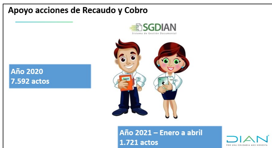
Ilustración 21. Gestión de actos notificados proferidos por el DG Recaudo y Cobranzas 2020 y 1er cuatrimestre 2021

Gracias a una eficiente labor desarrollada por el equipo de notificaciones de la Seccional Ibagué, se ha alcanzado una exitosa labor de apoyo reflejada, así: