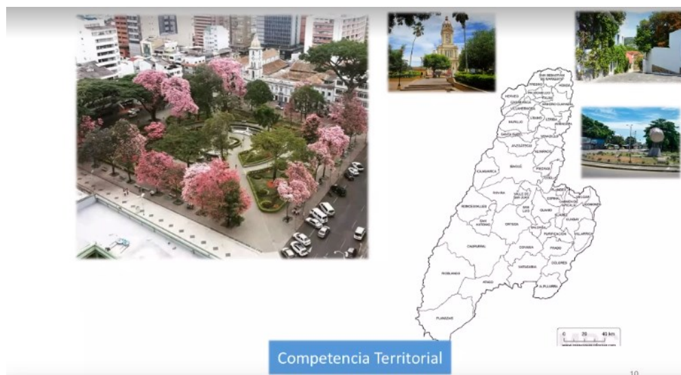
Ilustración 1. Competencia Territorial Seccional Ibagué

La estructura Orgánica de la Seccional Ibagué, está conformada por seis Divisiones: