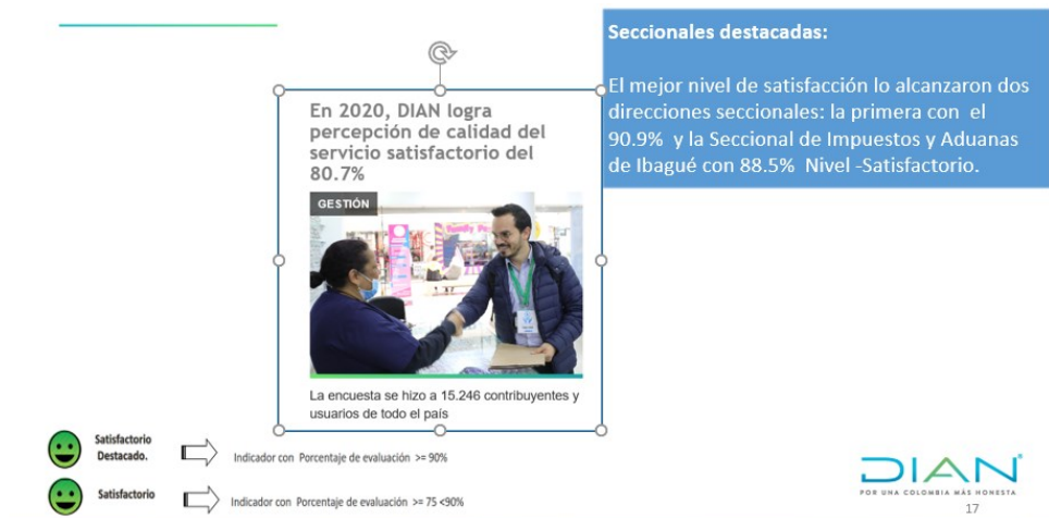
Ilustración 6. Resultados encuesta de satisfacción

Continuación del Acta de Comité de gestión Tributaria Aduanera y Cambiaria Dirección de Impuestos y Aduanas de Ibagué, junio 10 del 2021