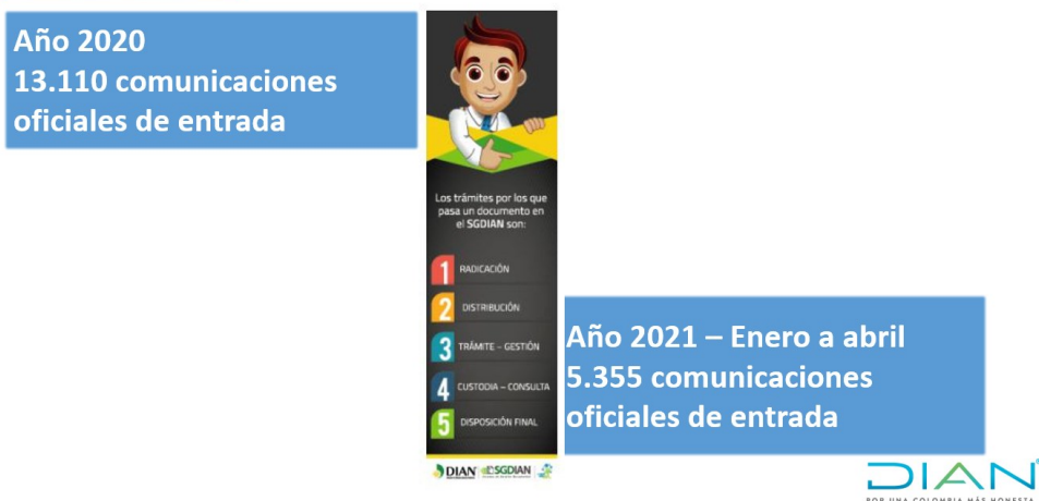
Ilustración 29. Gestión comunicaciones de entrada por la DG Administrativa y Financiera 2020 y para el cuatrimestre enero- abril año 2021