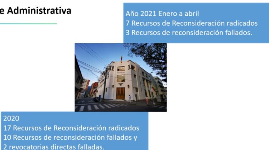
Ilustración 24. Gestión de recursos y revocatorias DG jurídica 2020 y 1er cuatrimestre 2021