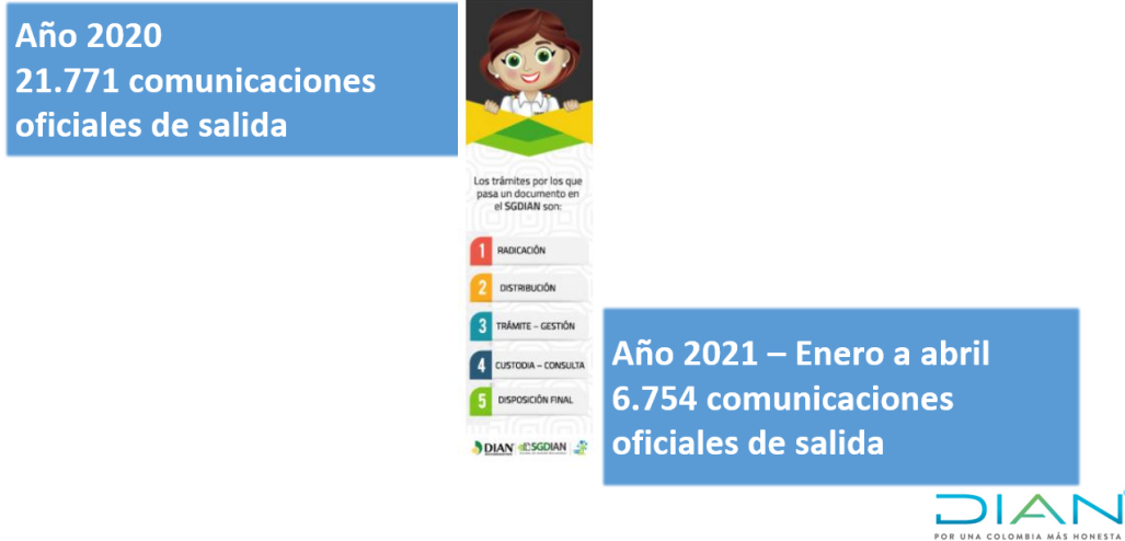
Ilustración 30. Gestión comunicaciones de salida por la DG Administrativa y Financiera 2020 y 1 cuatrimestre 2021

Para finalizar su intervención, informa que, respecto a la correspondencia física: