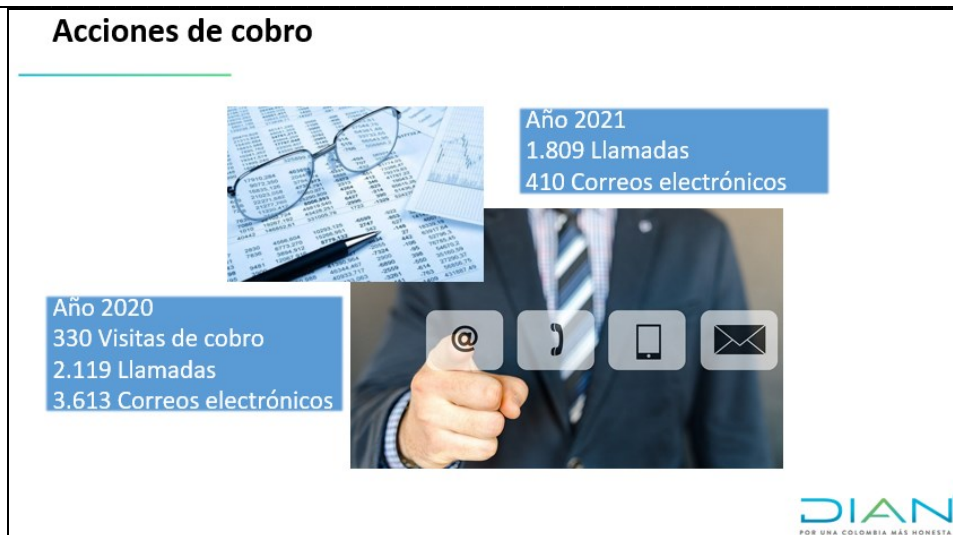
Ilustración 15. Gestión GIT Cobranzas 2020 y 1er cuatrimestre 2021

Continuación del Acta de Comité de gestión Tributaria Aduanera y Cambiaria Dirección de Impuestos y Aduanas de Ibagué, junio 10 del 2021