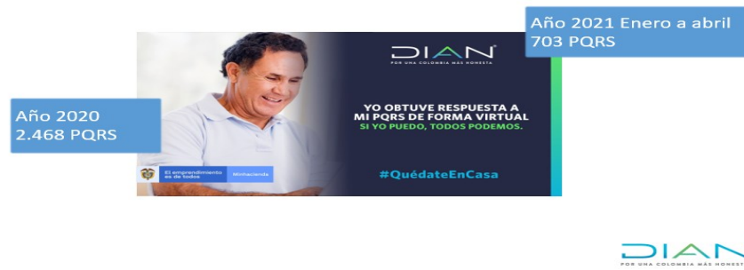
Ilustración 5. PQRS atendidas 2020 y 1er cuatrimestre 2021

A estas peticiones igualmente la Dirección Seccional Ibagué, como parte de la evaluación, control y seguimiento, de forma aleatoria realiza verificaciones de la calidad y oportunidad, obteniéndose en año 2020 y lo corrido de 2021 un 100% en calidad y oportunidad.