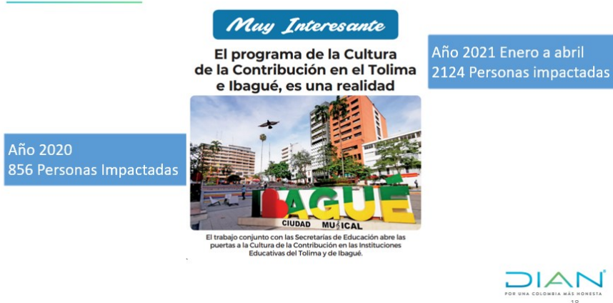
Ilustración 7. Persona impactadas año 2020 y 1er cuatrimestre de 2021