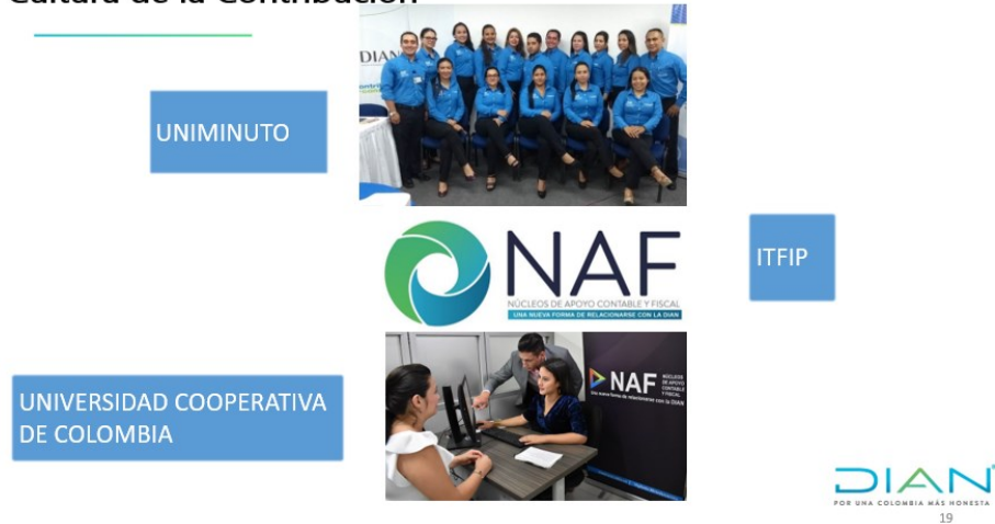
Ilustración 8. Núcleos de apoyo DIAN Ibagué