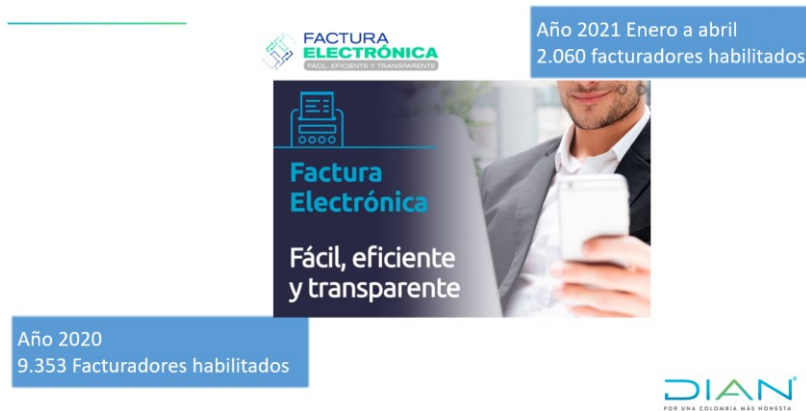
Ilustración 32. Sistema de factura electrónica año 2020-2021