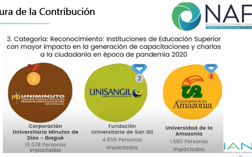
Ilustración 9. UNIMINUTO 1er lugar impacto a la ciudadanía en época de pandemia 2020