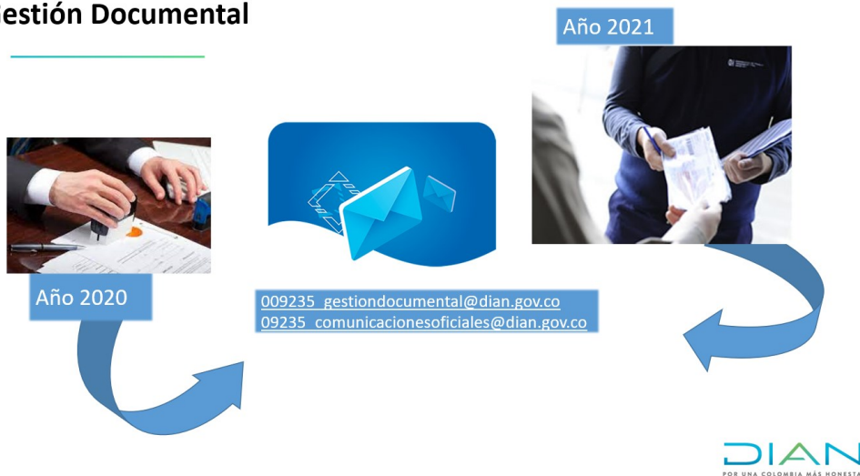
Ilustración 28. Buzones asignados entrada y salida de comunicaciones