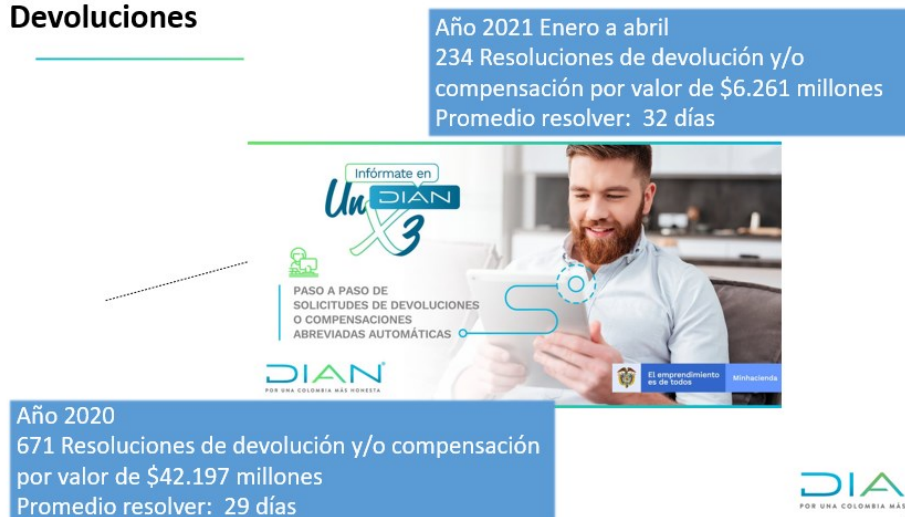
Ilustración 18. Resoluciones de devolución y/o compensaciones gestionadas por GIT Devoluciones 2020 y 1er cuatrimestre 2021

Para el año 2020, se alcanzó la siguiente gestión al respecto: