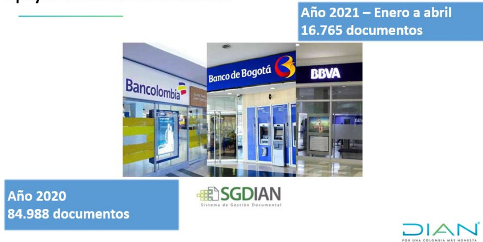
Ilustración 22. Gestión de recepción de actos EAR 2020 y 1er cuatrimestre 2021

Para el año 2020, se recibieron de las E.A.R: 84.988 documentos