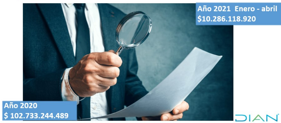
Ilustración 10. Gestión Efectiva DG Fiscalización y Liquidación 2020 y 1er cuatrimestre 2021