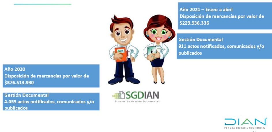
Ilustración 12. Gestión 2020 y 1er cuatrimestre 2021 - Disposiciones y Notificaciones

Durante el año 2020, la Seccional Ibagué notificó, comunicó y/o publicó 4.055 actos. Para lo corrido del año 2021 (enero- abril) se tienen, 911 actos notificados, comunicados y/o publicados.