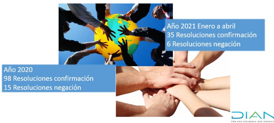
Ilustración 20. Resoluciones proferidas de confirmación o negación Régimen Tributario Especial-ESAL 2020 y 1er cuatrimestre 2021