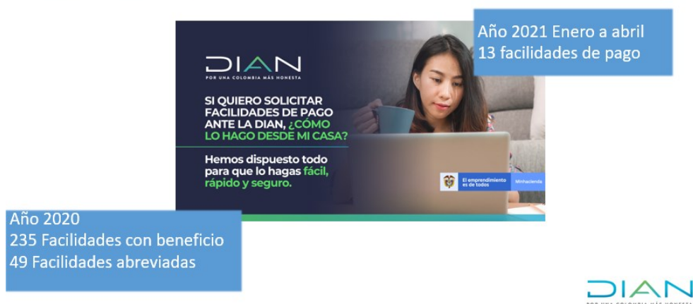
Ilustración 17. Facilidades de pago dada a contribuyentes y sectores económicos afectados por la emergencia sanitaria y económica 2020 y 1er cuatrimestre de 2021