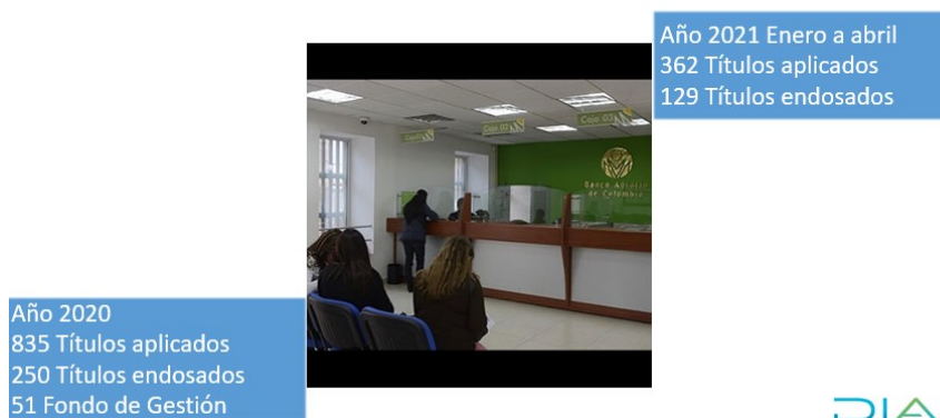
Ilustración 16 Gestión Títulos de depósito GIT Cobranzas 2020 y 1er cuatrimestre 2021

Adicionalmente, la jefe de la División informa que G.I.T de Cobranzas, se encarga de efectuar la labor hacer efectivo los títulos de depósito judicial para facilitar el pago de las obligaciones de los contribuyentes.