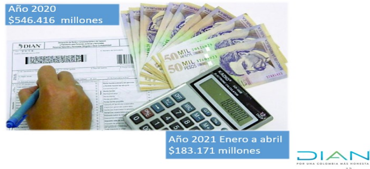
Ilustración 2. Recaudación Fiscal año 2020 y primer cuatrimestre año 2021

El Director Seccional, informa que para el año 2020 la cifra de recaudo alcanzó la suma de $546.416 millones, mientras que en el periodo enero a abril de 2021 el recaudo obtenido fue de $183.171 millones.