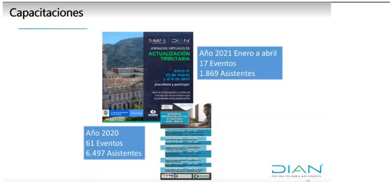
Ilustración 4. Capacitaciones efectuadas en el año 2020 y 1er cuatrimestre 2021

Continuación del Acta de Comité de gestión Tributaria Aduanera y Cambiaria Dirección de Impuestos y Aduanas de Ibagué, junio 10 del 2021