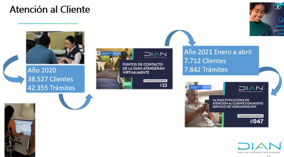
Ilustración 3. Gestión Asistencia al Cliente año 2020 y 1er cuatrimestre 2021

Desde febrero del 2020, la DIAN Seccional Ibagué instaló un equipo de Quiosco Virtual en la Cámara de Comercio del Sur Oriente del Tolima en la sede del Espinal, el cual consta de un equipo computo especial de pantalla táctil donde los clientes pueden habilitar la cuenta de usuario para autogestionar los trámites en línea relacionados con el RUT y presentar declaraciones entre otros.